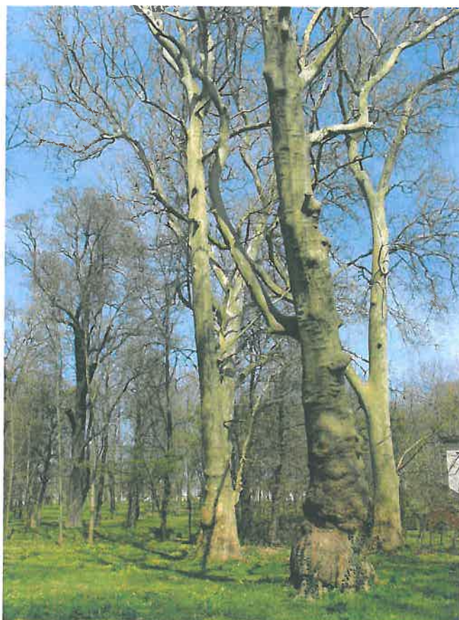
28. Platánfák a kastélypark közepén, a hrsz. 1067/1 telken (HNG, 2016)