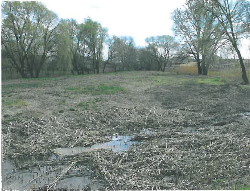
38. A kastélykert déli végén található sziget, hrsz. 1090 (HNG, 2016)