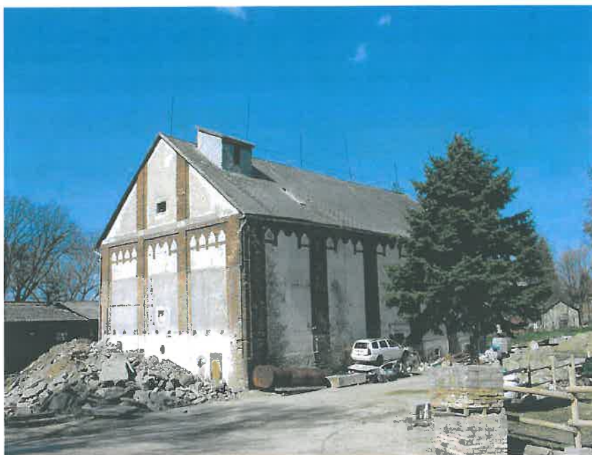
10. Az egykori magtár épülete, hrsz. 1032/1 (HNG, 2016)