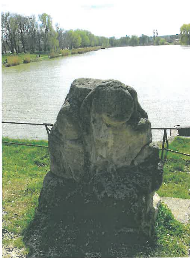
23. A Neptun-szobor torzója a tó északi partján (HNG, 2016)