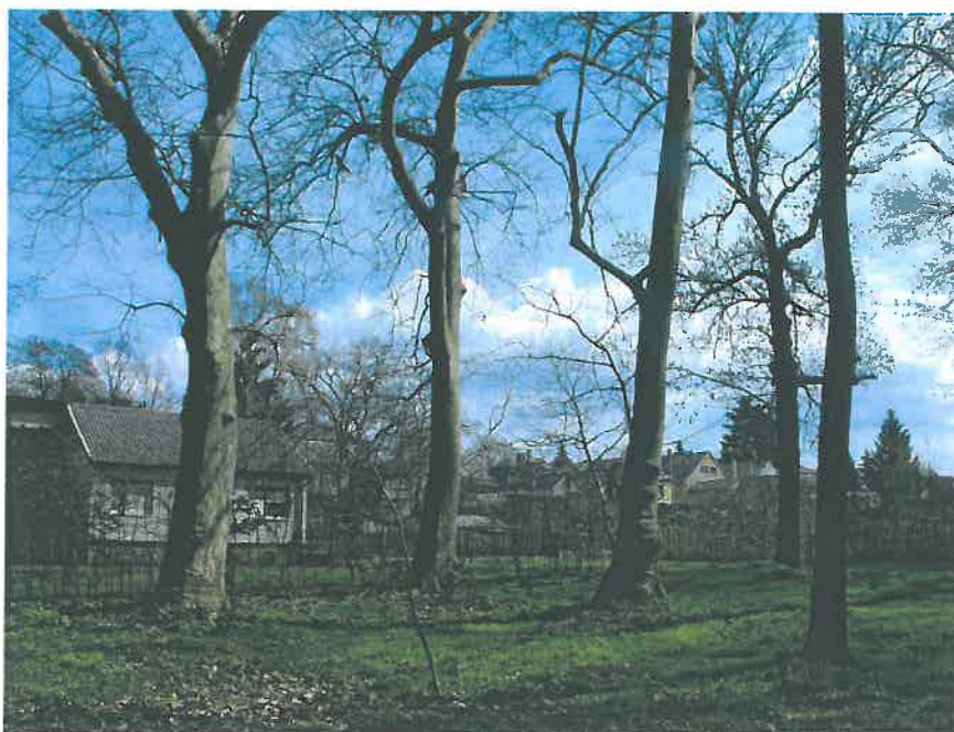
29. Platánfák a kastélypark közepén, a hrsz. 1067/1 telken (HNG, 2016)