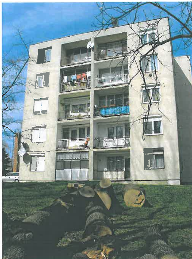
35. Egy közelmúltban kivágott történelmi értékű magas kőrisfa a kastélypark északnyugati részén (HNG, 2016)