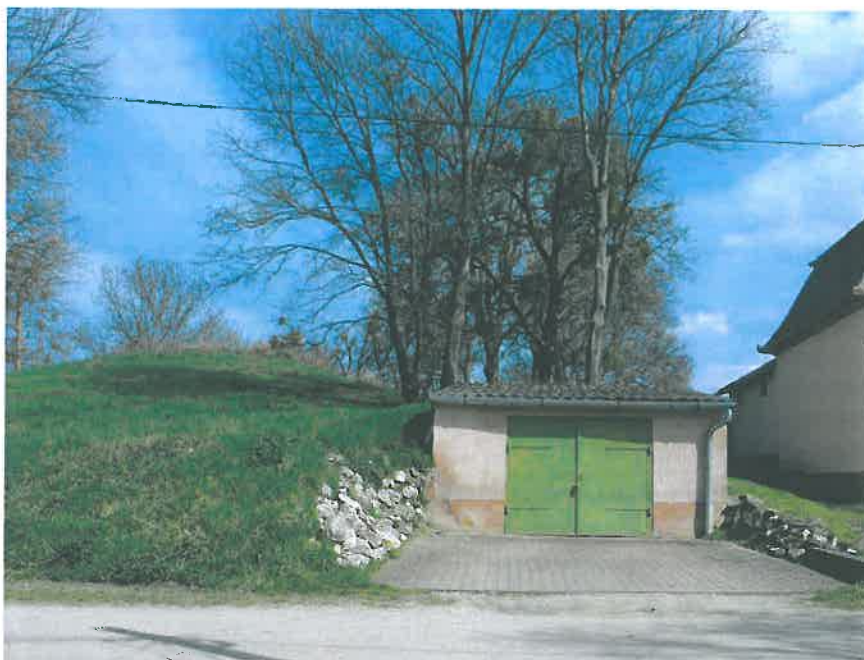
9. Garázs a Wenckheim-halom kastély felé eső délnyugati sarkában, Szabadság utca, hrsz. 882/1 (HNG, 2016)