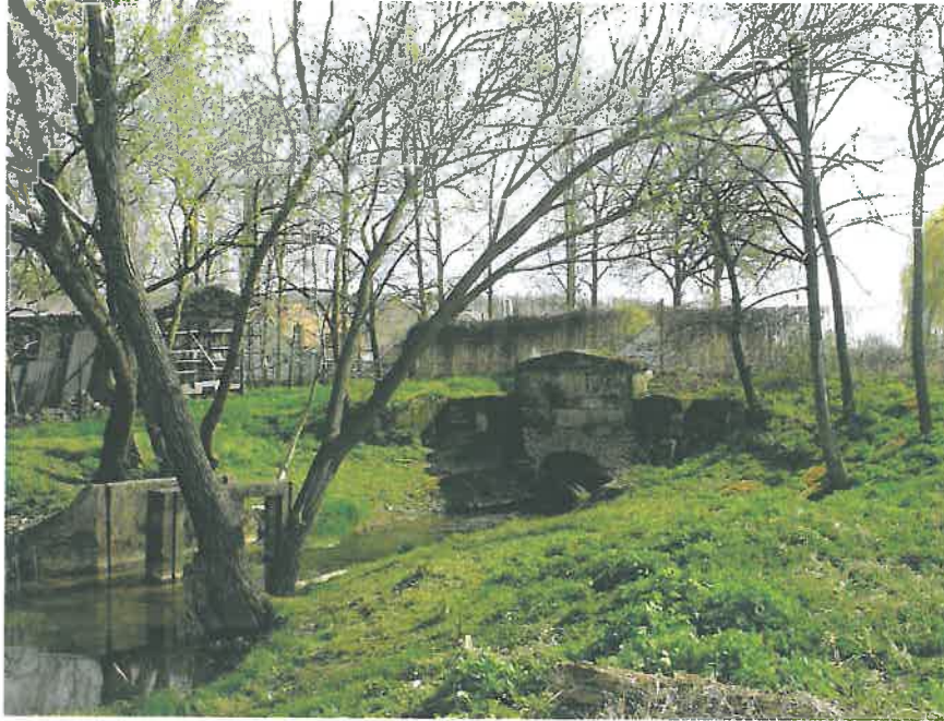
40. A felső köhid északi pofafala, amely akár kert staffázsépítmény (mitologikus motívumokkal díszített mesterséges forrás) is lehetett (HNG, 2016)