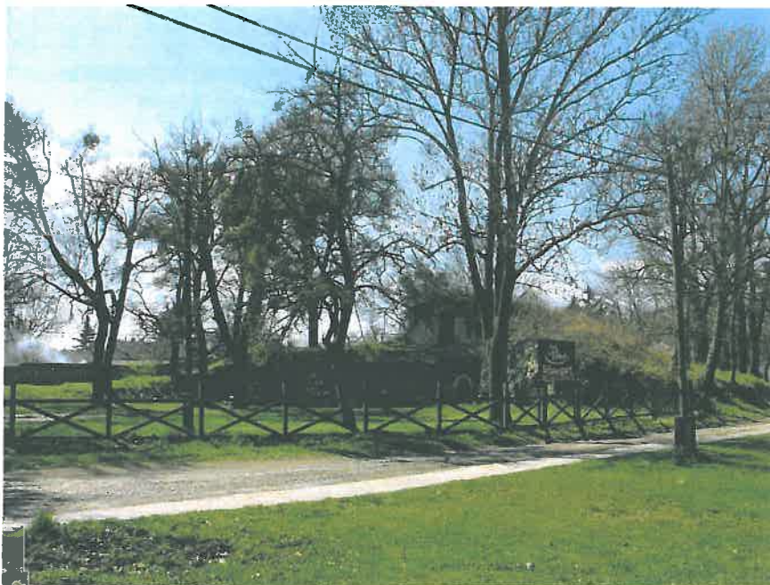
8. Pokol Sörkert (grotta), egykori Wenckheim-halom, hrsz. 882/2 (HNG, 2016)