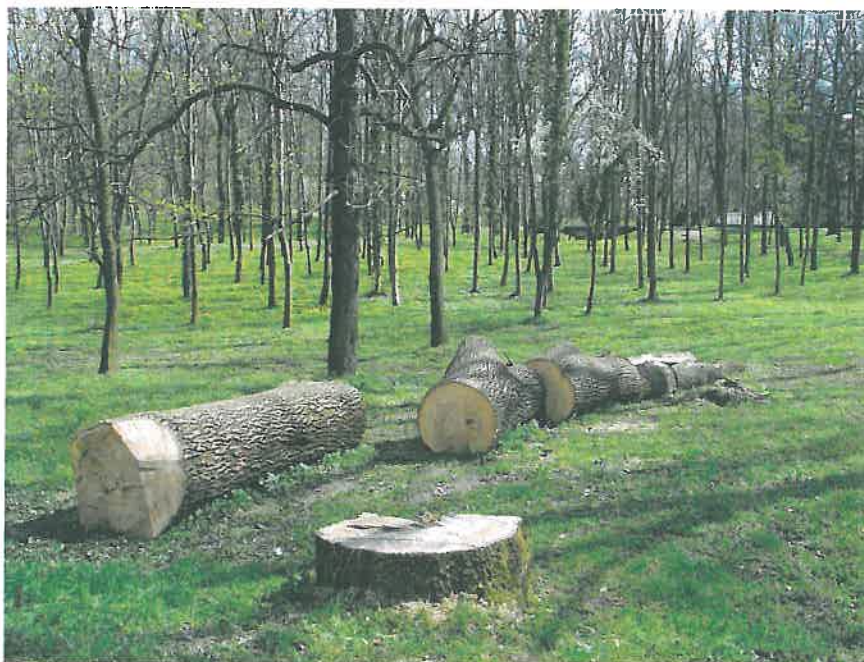
36. A „ház veszélyeztetése miatt” kivágott egészségesnek látszó magas kőris maradványa (HNG, 2016)