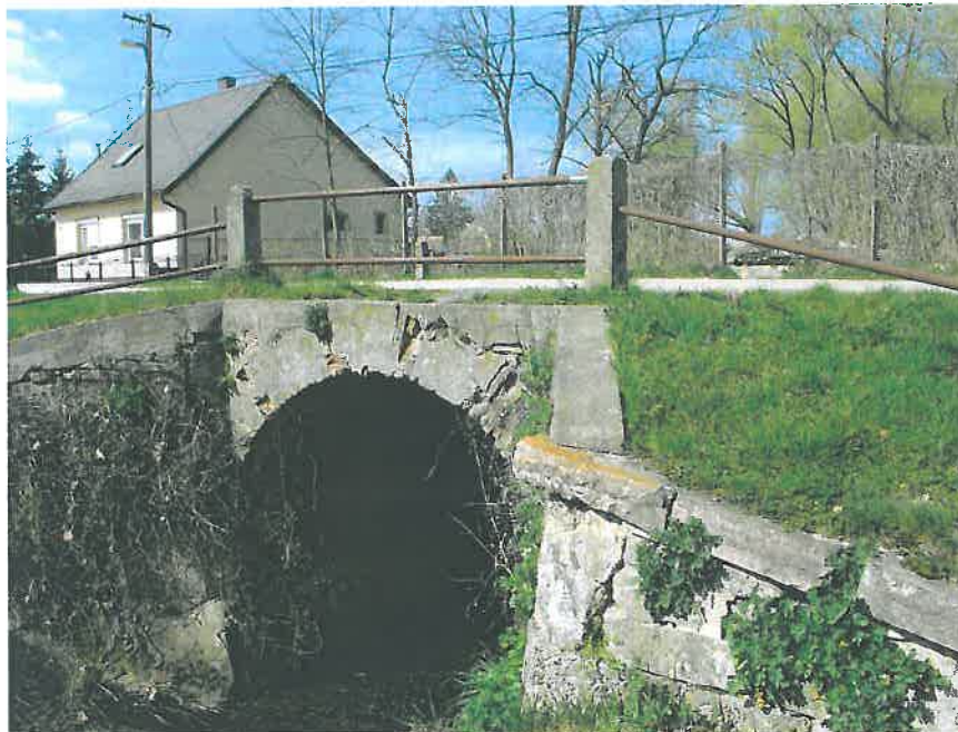
43. A híd déli oldalán a régi hídból megmaradt kemény kötömbök láthatóak (HNG, 2016)