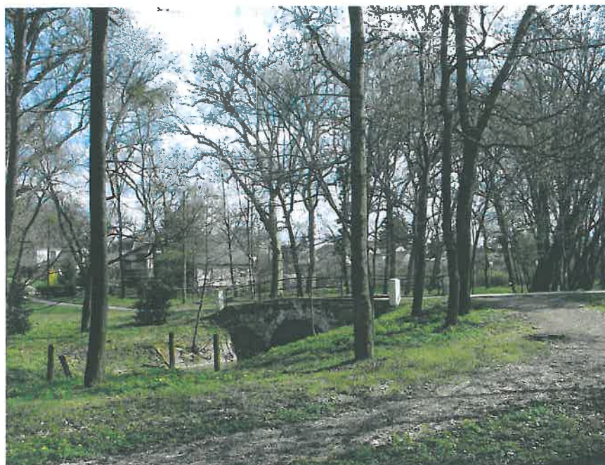
31. Az alsó kőhíd északi oldala (HNG, 2016)