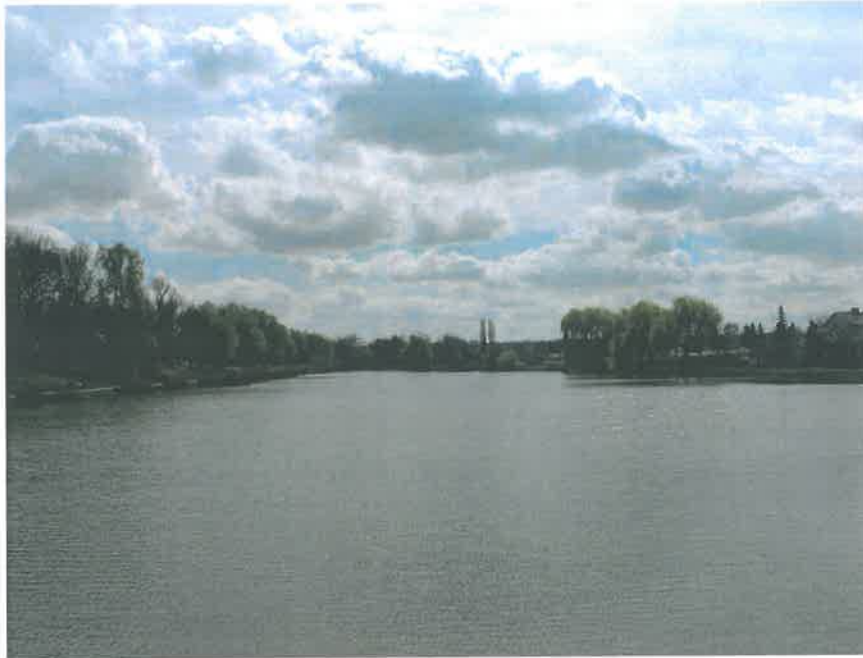
22. A Kisbéri-ér által táplált Park-tó, D felé tekintve (HNG, 2016)