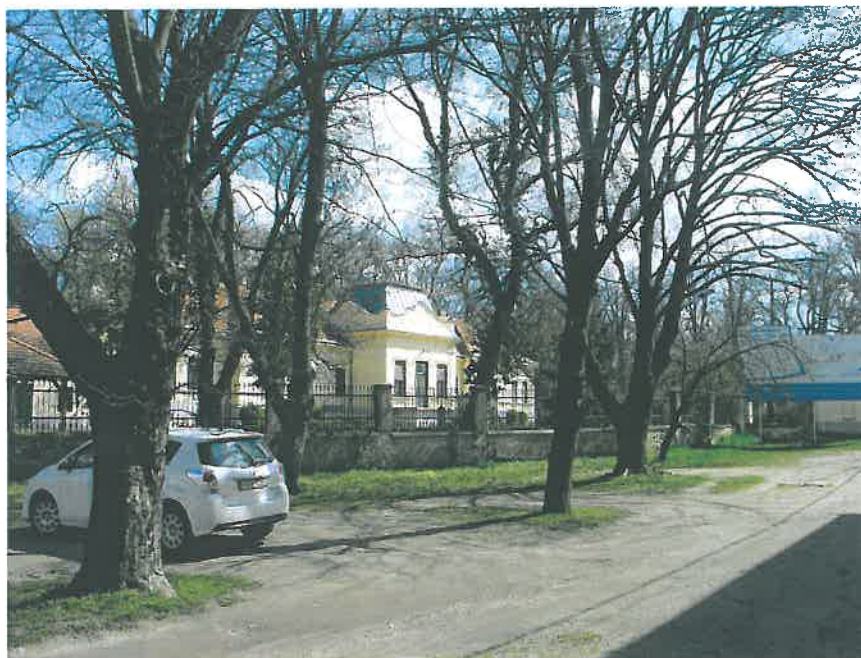
15. A volt Ménesparancsnokság előtti fák (HNG, 2016)