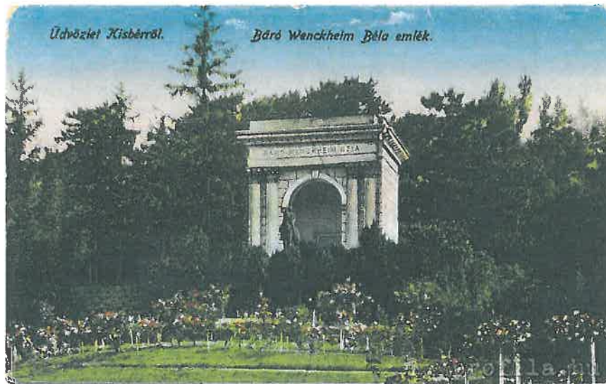
7. Wenckheim Béla emlékműve a mesterséges domb kastély felőli oldalán (képeslap az 1900-as évek elejéről [Profila])