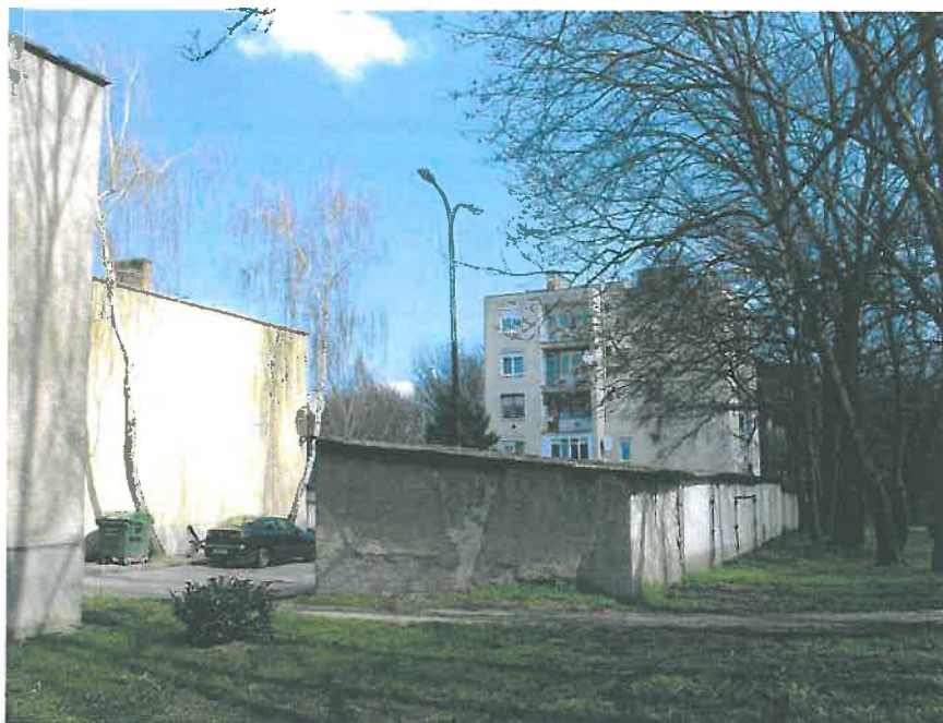
12. Garázsok a lakótelep park felé eső oldalán