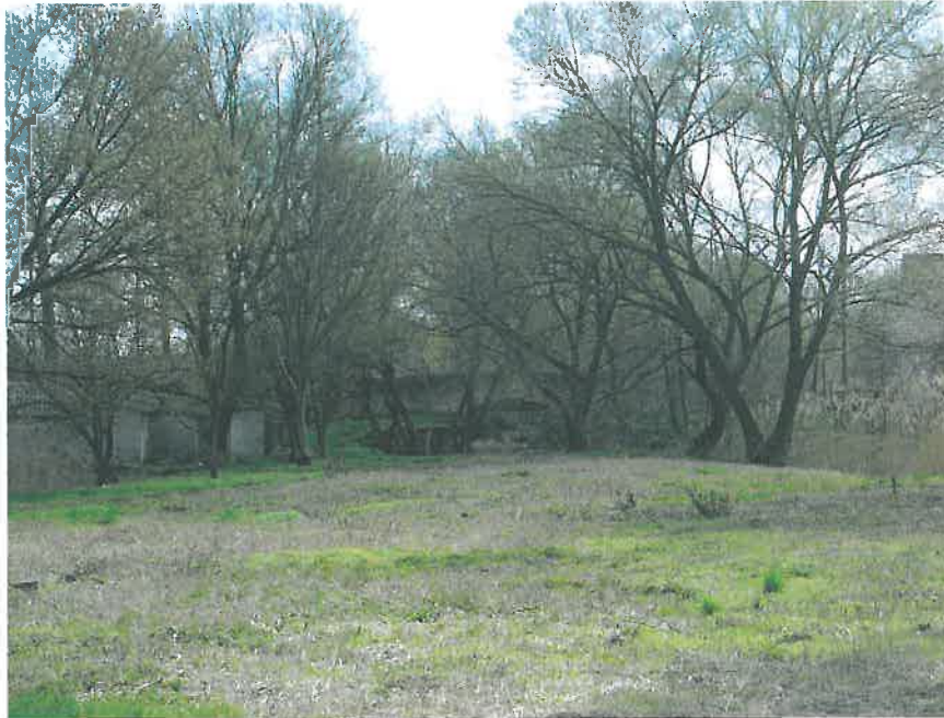
39. A sziget végén feltűnik a felső kőhíd kontúrja (HNG, 2016)