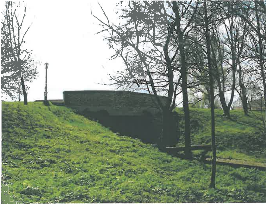
26. A felismerhetetlenségig átalakított középső híd a Park-tó északi, kastély felőli oldalán (HNG, 2016)