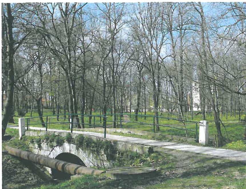
30. Az alsó kőhíd déli oldala, háttérben a rk. templommal (HNG, 2016)