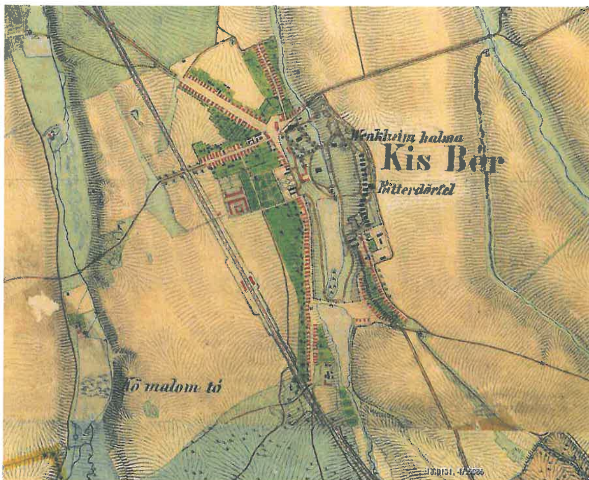
1. A kispéri angolkert a második katonai felmérés idején, 1806-1869