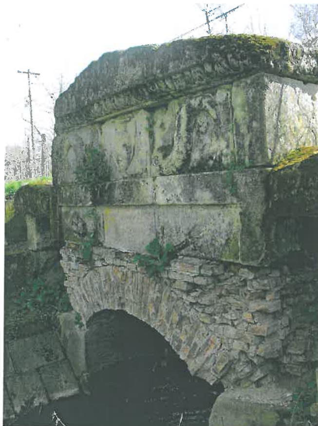
41. Az 1930-ban (véltetően) felújított/átépített köhid északi homlokzatának felső képszején egy antikizáló vízmerítő kancsó látható, amelyre két delfin tekint. A téglaboltzat fölötti, kertelt, három részből álló kötömb közepső tagján „1930” felirat szerepel, amelyet két oldalán egy-egy tridens (háromágú szigony) fog közre. (HNG, 2016)