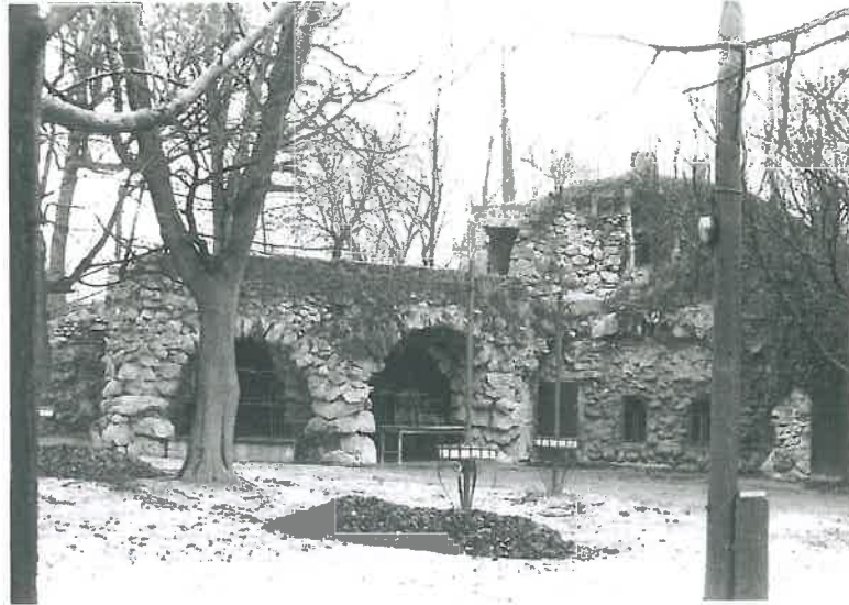
6. A „Sörkert” (más néven „Pokol csárda”) az 1980-as évek elején (Forster Kp. Tervtára, ltsz. 31176)