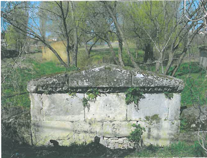
42. A timpanon (oromzat) alján a tojássor körbefut (HNG, 2016)