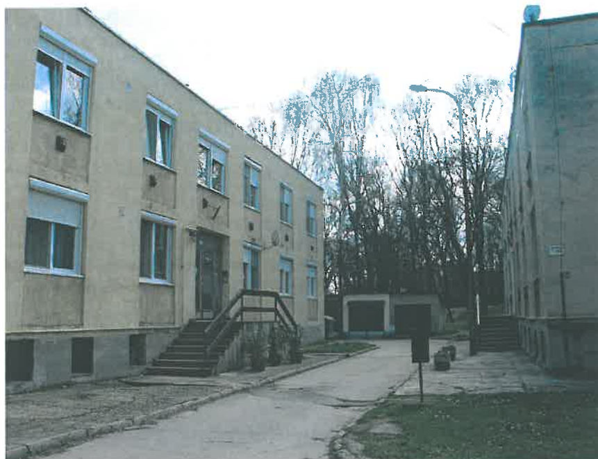
11. Lakótelep a kastélypark északnyugati részén, amelyek a hrsz. 1035/36-ban állnak (HNG, 2016)