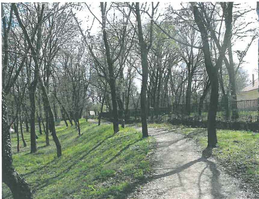
14.Kastélypark részlet a volt Ménesparancsnokság épülete mögött (HNG, 2016)