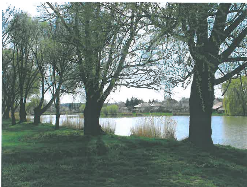
37. Fűzfák a Park-tó keleti partján (HNG, 2016)