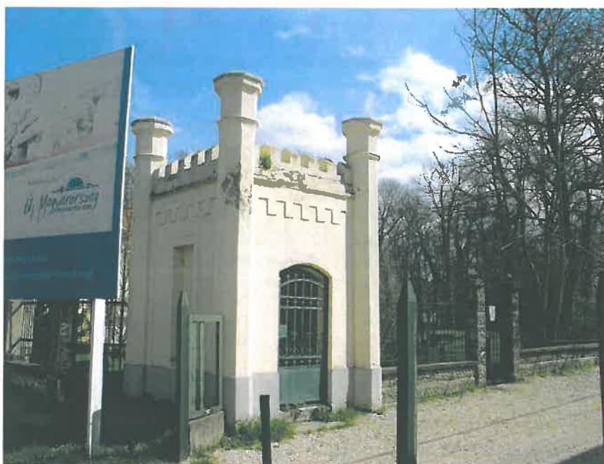
16. Kapusház a volt Ménesparancsnokság előtt (HNG, 2016)