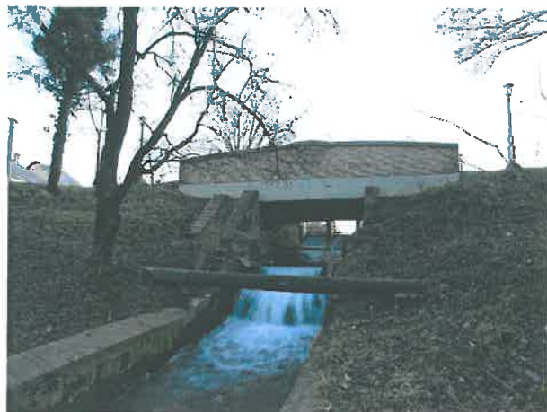
4-5. A híd 1983-ban (Forster Kp. Tervtára, ltsz. 31176), majd az átépítést követően (HNG, 2011)