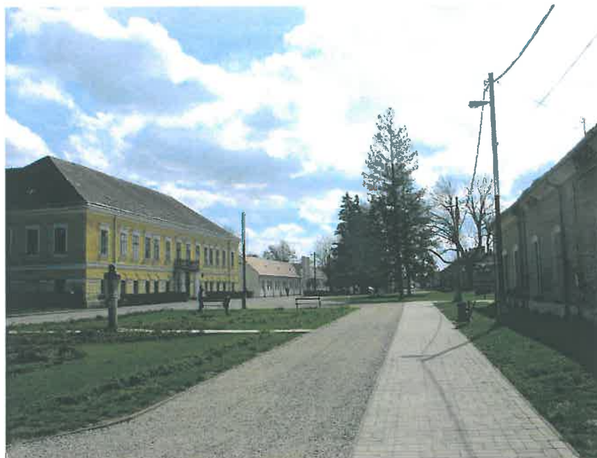
19. Parkrészlet a Battyány-Wenckheim-kastély előtt, hrsz. 1071 (HNG, 2016)