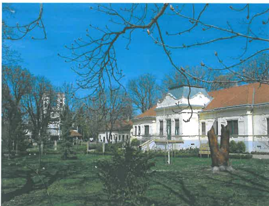
17. A volt Ménesparancsnokság, mögötte a rk. templommal; a látványkapcsolatba a Bakony Áruház silány építészeti tömege ékelődik (HNG, 2016)