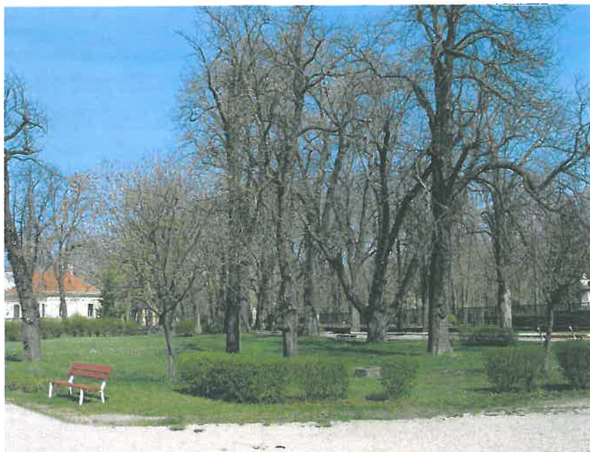
18. Parkrészlet a Battyány-Wenckheim-kastély előtt, hrsz. 1071 (HNG, 2016)