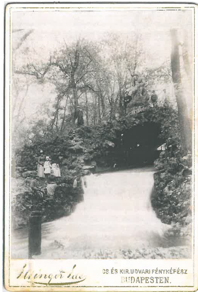
3. Ellinger Ede fényképe a Neptun-szoborról és a grotta-hídról Kisbéren, 1900 körül (Örsi Károly gyűjteménye)