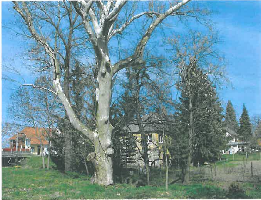
34. Egy másik kapitális nagyságú platánfa a Kisbéri-ér partfalában, a kastélypark északi, középső részén (HNG, 2016)