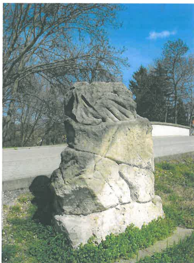
24. A Neptun-szobor torzója a tó északi partján (HNG, 2016)