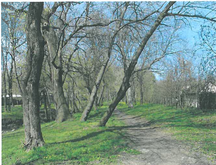
27. Kerti sétaút vezet a Neptun-szobortól a Pokol-grottáig a patak partján (HNG, 2016)