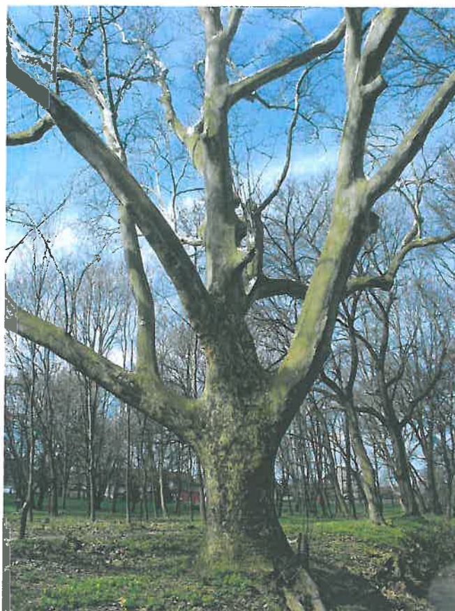
33. Kapitális nagyságú platánfa a Kisbéri-ér partfalában, a kastélypark északi, középső részén (HNG, 2016)