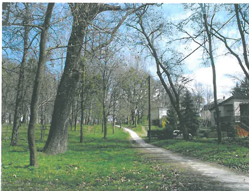
32. Idős magas kőris az alsó kőhíd és a Pokol között (HNG, 2016)