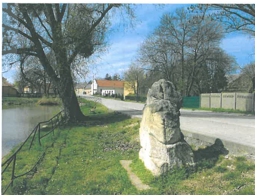
25. A Neptun-szobor torzója a tó északi partján (HNG, 2016)