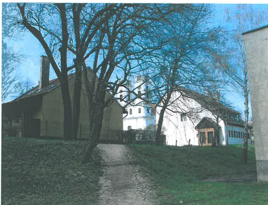
13. Jobbra a rendőrség épülete, balra a gyógyszertár épülete, amelyek betakarnak a kéttornyú Nagyboldogasszony templom látványába (HNG, 2016)