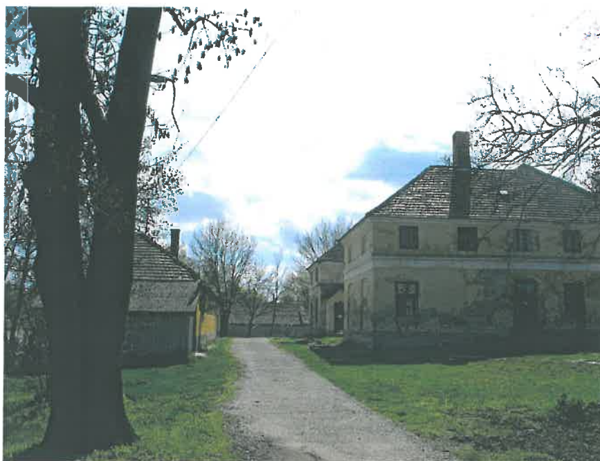
21. Az egykori Úri lak kertje, hrsz. 1074 (HNG, 2016)