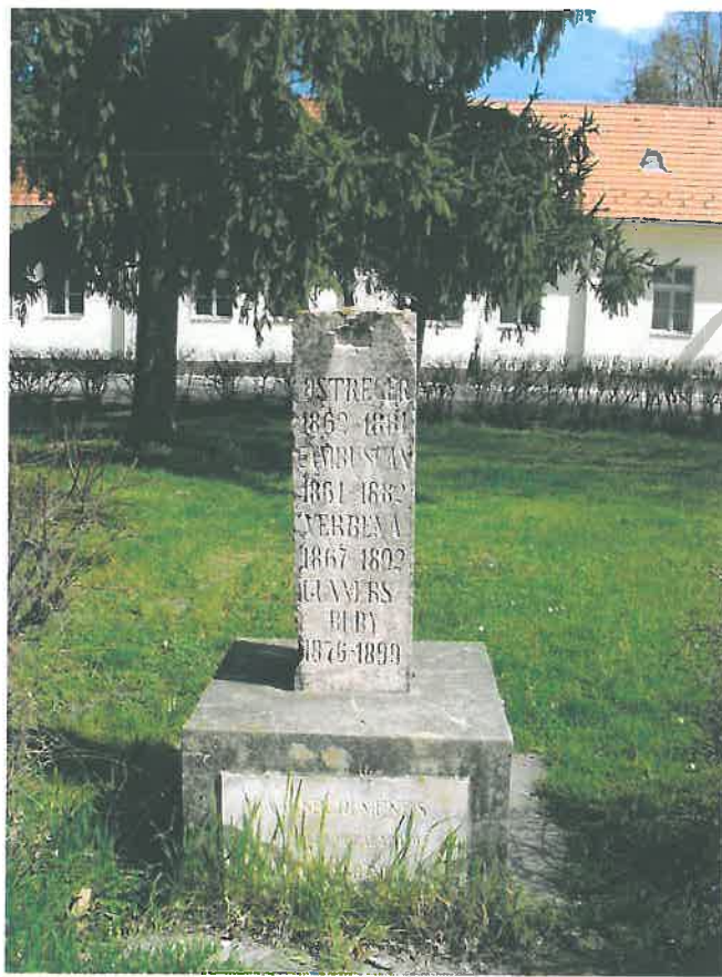
20. A törzsmének emlékoszlopa a Kormányhivatal épülete előtti parkban (HNG, 2016)