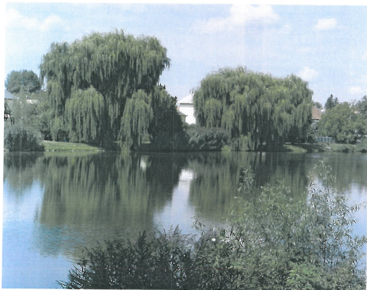
A Nagy-tó és a partját szegélyező szomorúfüzek