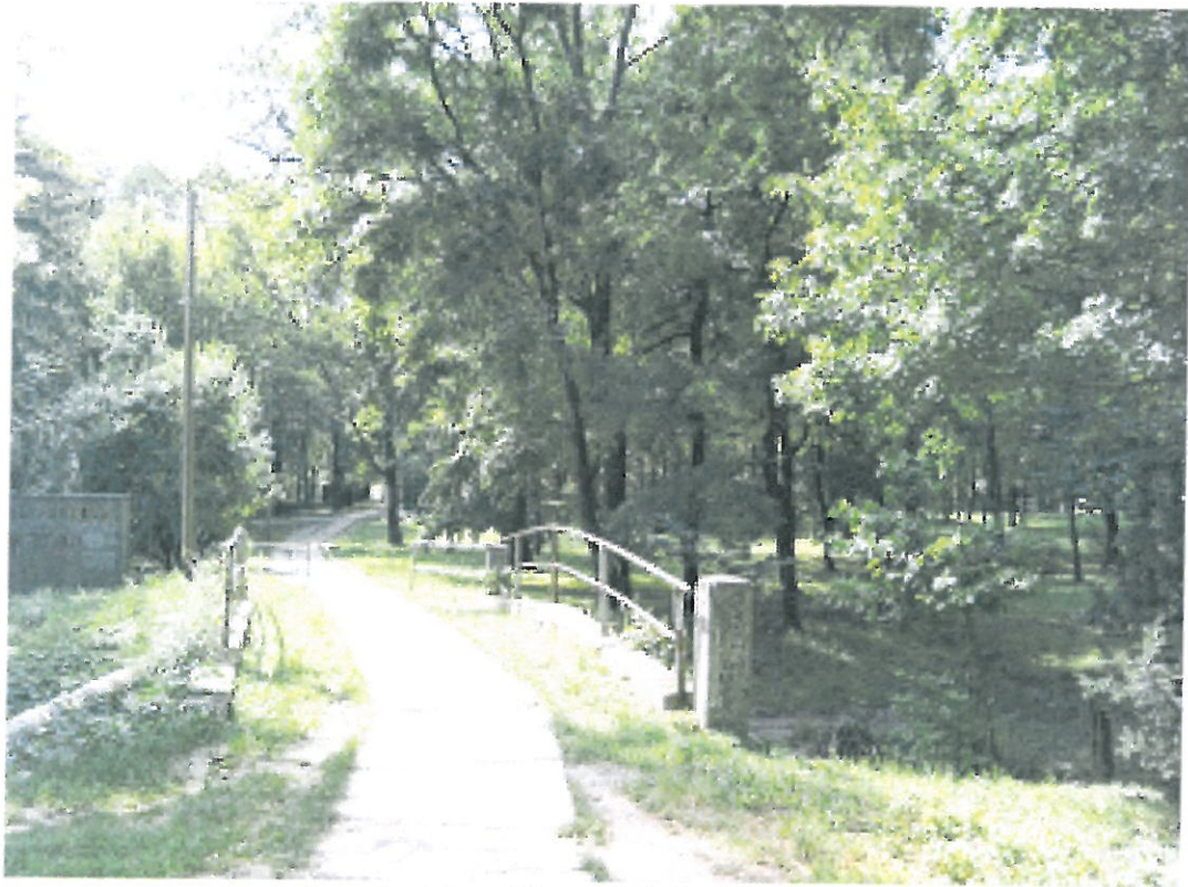
A parkot átszelő patak feletti gyaloghíd