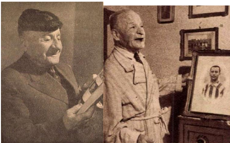
Labdarúgás 1959. 2. számában