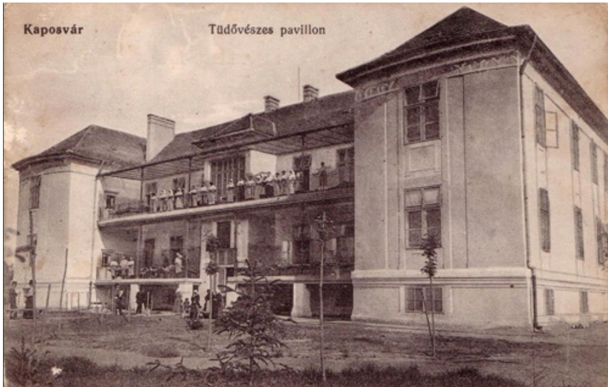
A kaposvári Tüdővészellenes-pavillon (Pozsonyi Imre tervei alapján)

én felavatott Tüdővészellenes-pavilont, amely a korszak legmodernebb higiénikus követelményeinek megfelelő egészségügyi intézménye volt.