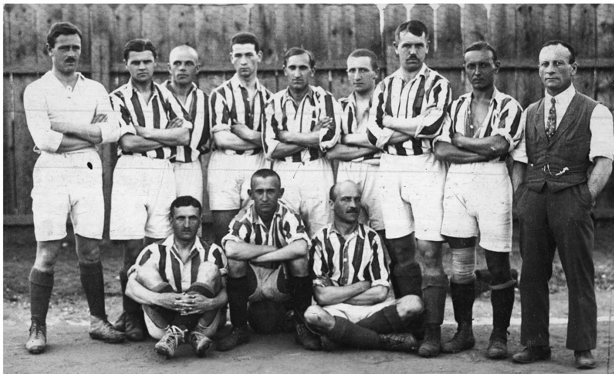
A Cracovia 1921. évi bajnokcsapata

Nem volt ez másképpen a felkészülési és barátságos meccseken sem. Otthon senki nem tudta legyőzni a Cracoviát. Az év folyamán huszonöt barátságos meccsen tizenkilencszer hagyták el győztesen a pályát, háromszor játszottak döntetlent és háromszor kaptak ki. Pozsonyi irányításával 1921-ben nyolc alkalommal játszottak külföldi csapat ellen. Hat alkalommal magyar, egy-egyszer pedig osztrák, illetve csehszlovák ellenféllel játszottak. Ezekre az összecsapásokra főképpen akkor került sor, ha két bajnoki mérkőzés között hosszabb idő telt el. Így hívták meg júniusban a Kispesti AC-t két mérkőzésre (1:0, 2:4), majd júliusban az Újpestet (2:1), a Wackert (0:1) és a Terézvárosi TC-t (1:1), október elején pedig Budapesten fogadta őket az FTC (1:0) és az MTK (0:0).