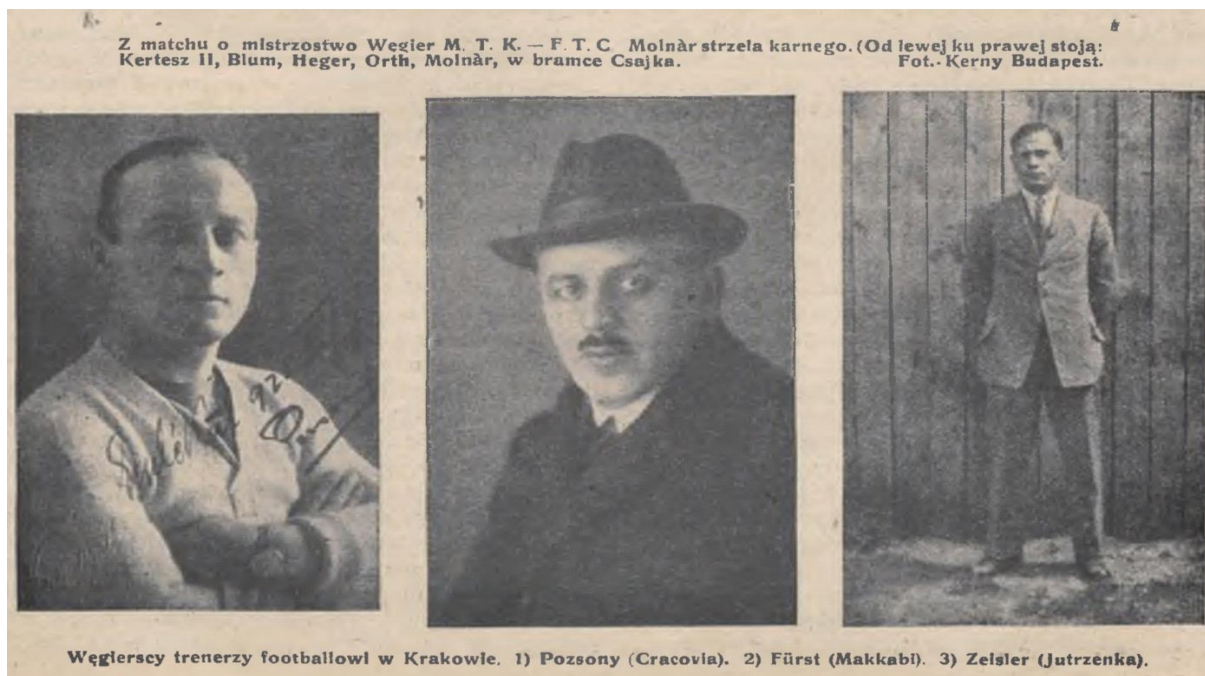
A három magyar tréner a Tygodnik Sportowy 1922. április 12-i számában.