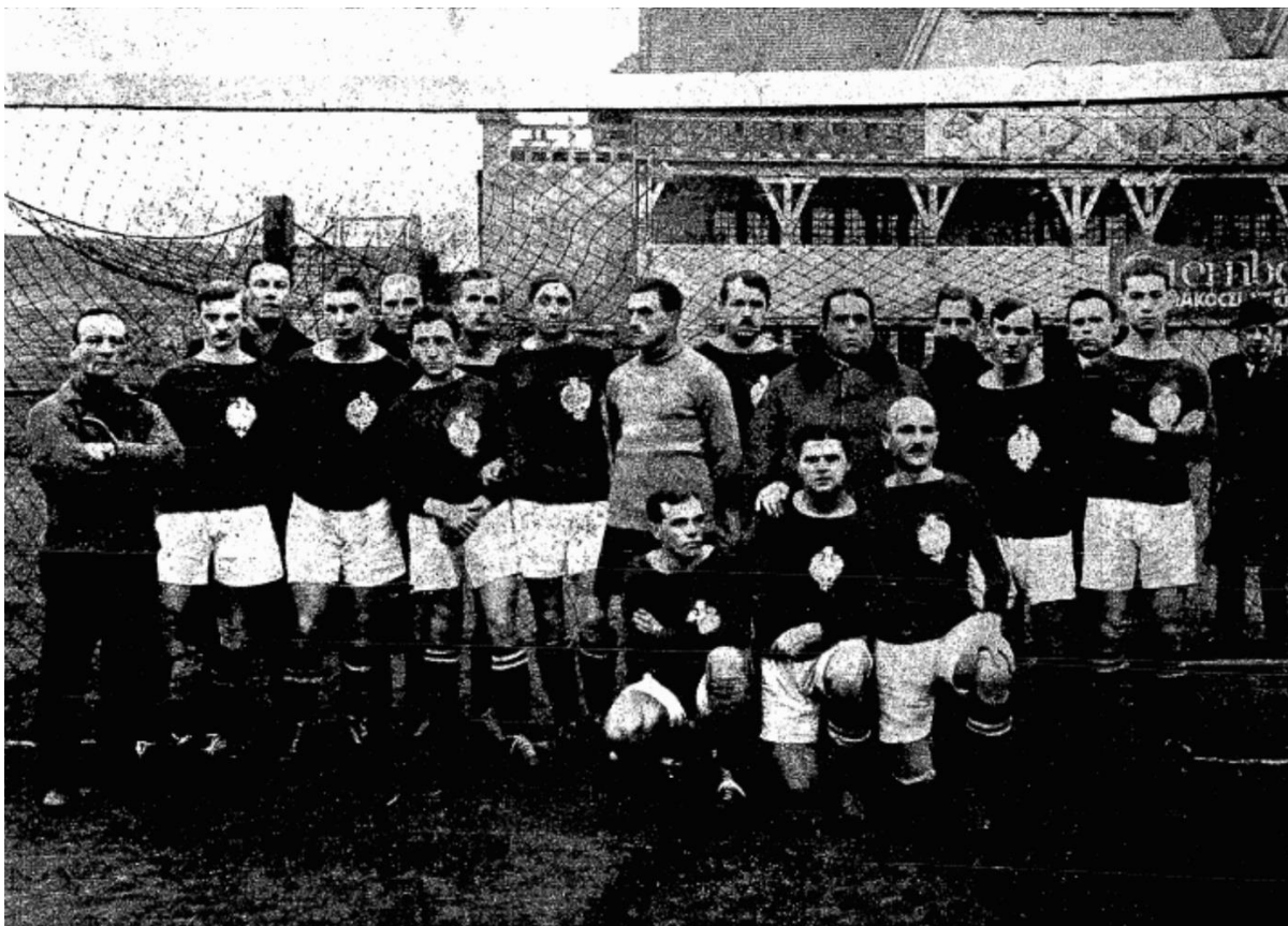
A lengyel válogatott az MTK-pályán 1921. december 18-án